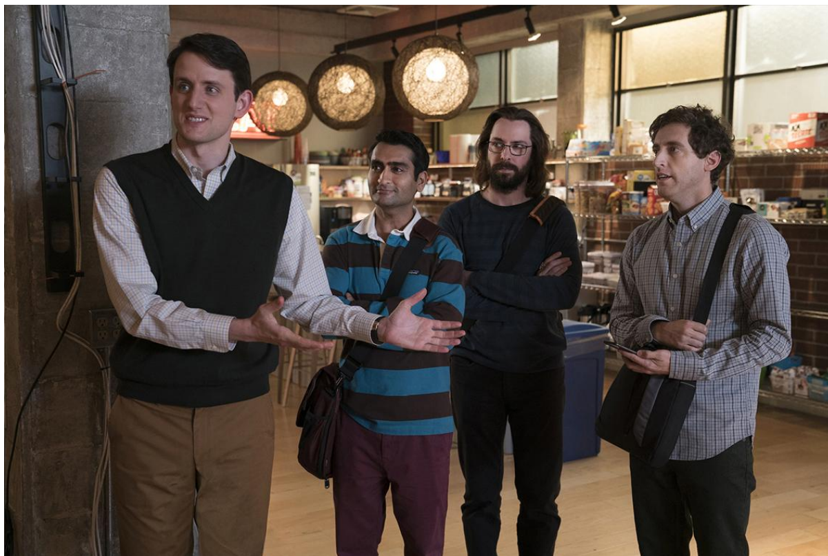
Кадр из фильма «Кремниевая долина»

Это обязательно что-то ценное, например, денежные средства, движимое и недвижимое имущество или даже важная информация. Активы бывают реальными / материальными (авто, квартира, ценные бумаги) и полностью цифровыми.